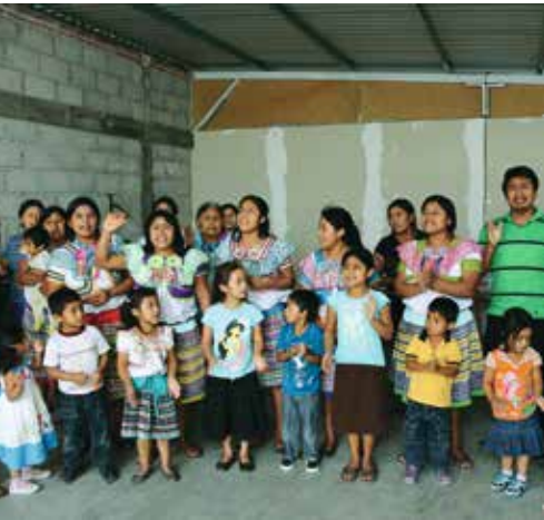
Christen, die aus dem Dorf Buena Vista Bauhuitz in Chiapas vertrieben wurden, loben Gott.

„Sei treu bis zum Tod, und ich werde dir die Krone des Lebens geben.“ (Offb. 2,10)