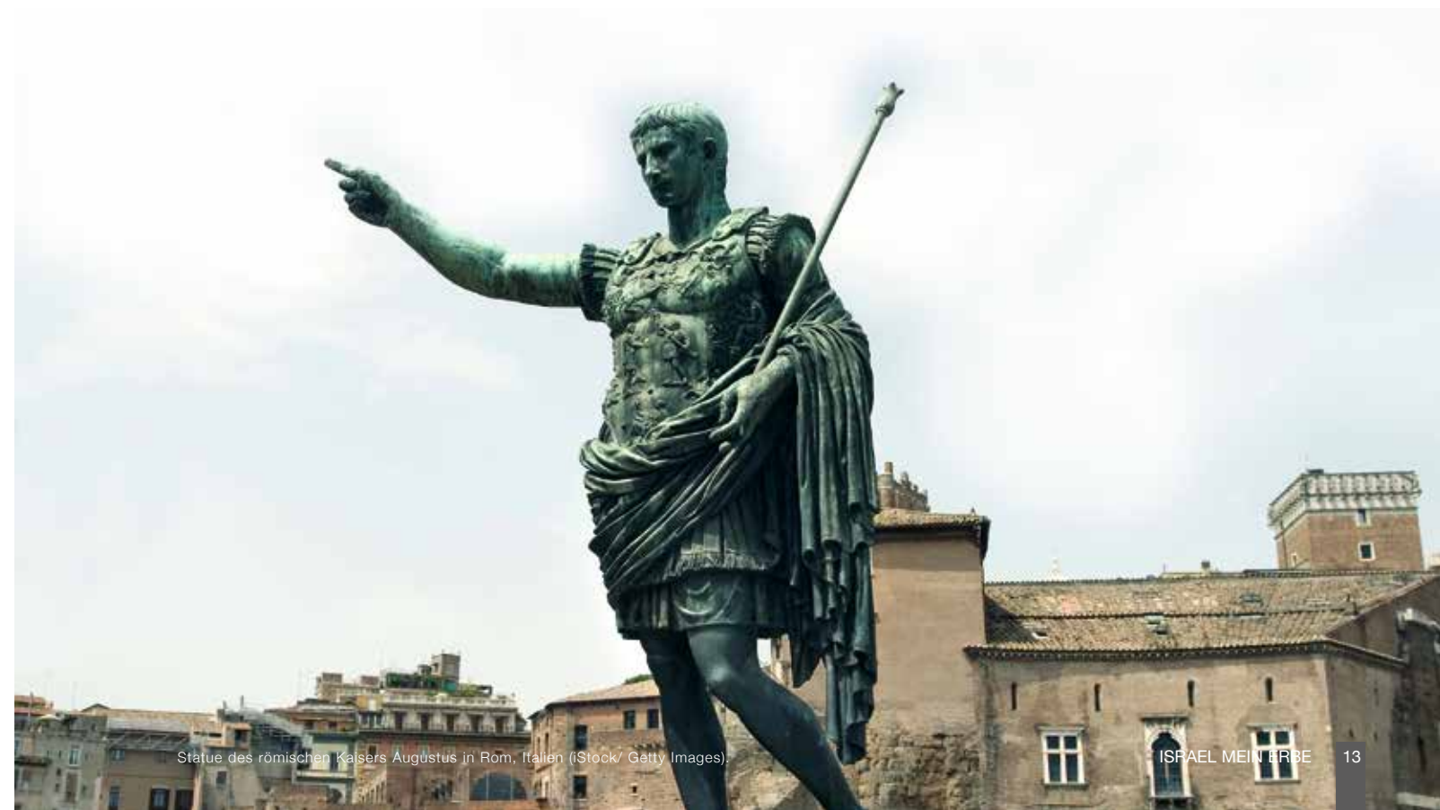
Statue des römischen Kaisers Augustus in Rom, Italien.

Der Aufstieg des römischen Weltreichs beschleunigte die Verbreitung des Evangeliums. Wenn Jesus in eine Welt gekommen wäre, die in Tausende abgeriegelter und schwer befestigter Königreiche geteilt gewesen wäre, hätte sich die Gute Nachricht nur quälend langsam verbreiten können. Die berühmte Pax Romana („Römischer Friede“) war nicht angenehm für die Menschen unter ihrer Herrschaft, aber sie