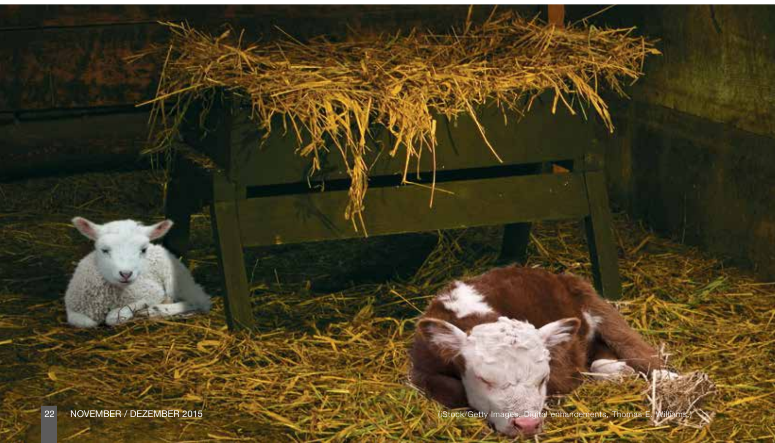
(iStock/Getty Images, Digital enhancements, Thomas E. Williams)